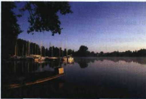
© M. Haupt, L. Grawe, D. Schuler