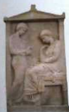
Reliefkunst: Heges und ihre Dienerin