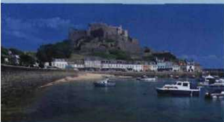
Mont Orgueil Castle

Wer auf die Kanalinseln reist, hat das große Ferienlos gezogen. Die schönsten Küsten und herrliche Strände, aber auch diverse Sehenswürdigkeiten warten auf allen fünf bewohnten Inseln des Archipels. Zur besseren Orientierung hier vorab eine Übersicht über die Ziele, die Sie auf keinen Fall versäumen dürfen!