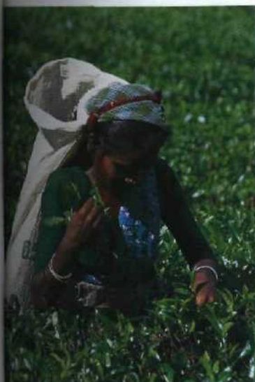
Mühsam geerntet, aber ein Hochgenuss: Tee aus Sri Lanka.