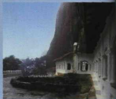
Sri Lankas eindrucksvollster Höhlentempel in Dambulla erscheint wie aus dem Fels herausgewachsen.