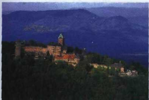
Hilfsausgabe ff. Champagne/MICHELIN