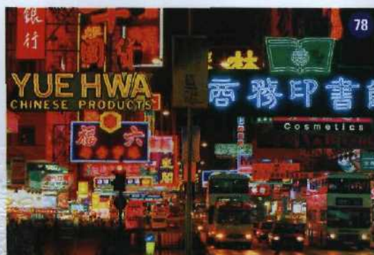
78 Farben bringen Ordnung ins Chaos. Lichterflut in Kowloon, Hongkong (li.)

Ganz neuer Ausblick: Frank O. Gehrys Guggenheim Museum in Bilbao (re.)