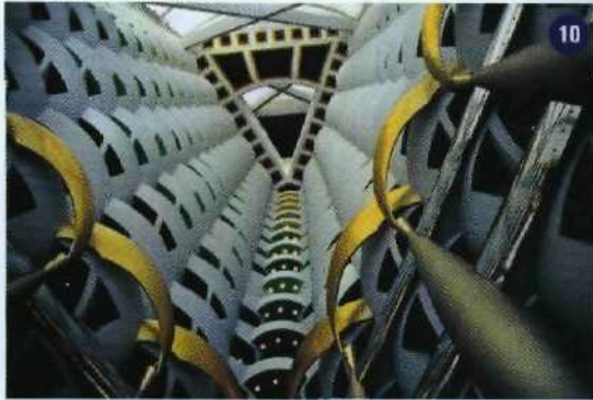
10 Luxushotel Burj Al Arab in Dubai: Herausforderung für die Sinne (li.)

Die Erde leuchtet: bizarre Granitfelsen an der bretonischen Küste (re.)