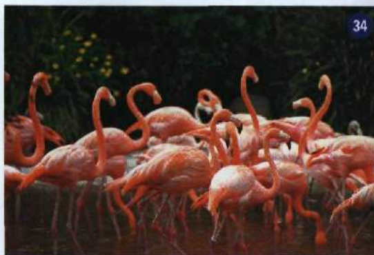
34 Schönheit durch Diät: Kleine Krebse bringen Fla- mingos zum Erröten (li.)

Die 1268 »Schokoladen- hügel« auf der philippini- schen Insel Bohol (re.)