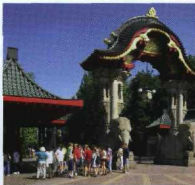
Der Zoologische Garten: nicht nur wegen Eisbär Knut der Hit für Kids