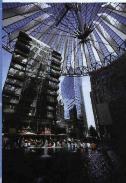
Futuristische Architektur am Potsdamer Platz: das Zelt Dach des Sony Centers