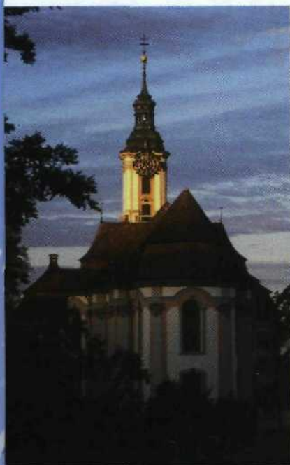
Die Wallfahrtskirche in Birnau (→ S. 53) ist ein echtes Schmuckstück