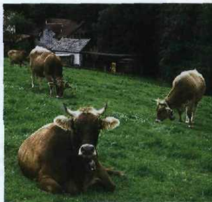
Aus ihrer Milch wird leckerer Appenzeller Käse (→ S. 16)