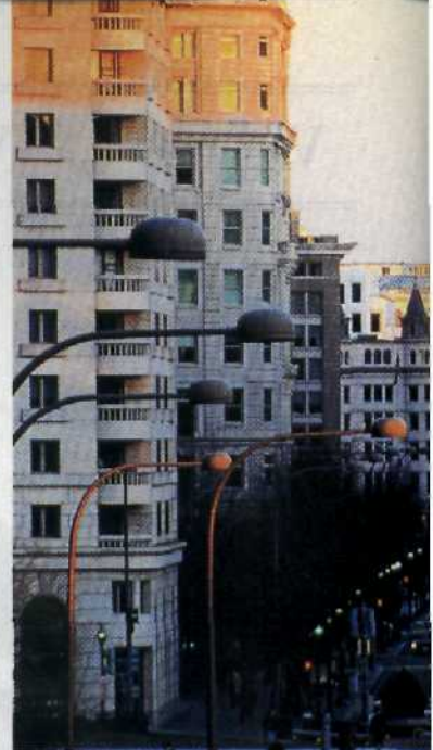
Ort der Paraden und Feierlichkeiten