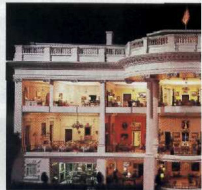
Puppen- stube einer Welt- macht: Un- gewohnte Einblicke in das Innen- leben des Weißen Hauses...40