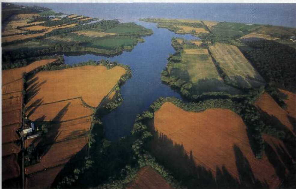
Wo Virginias Flüsse in den Atlantik münden: die Chesapeake Bay.....88