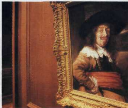
Die Mall: Alte Meister, neue Kunst.....72