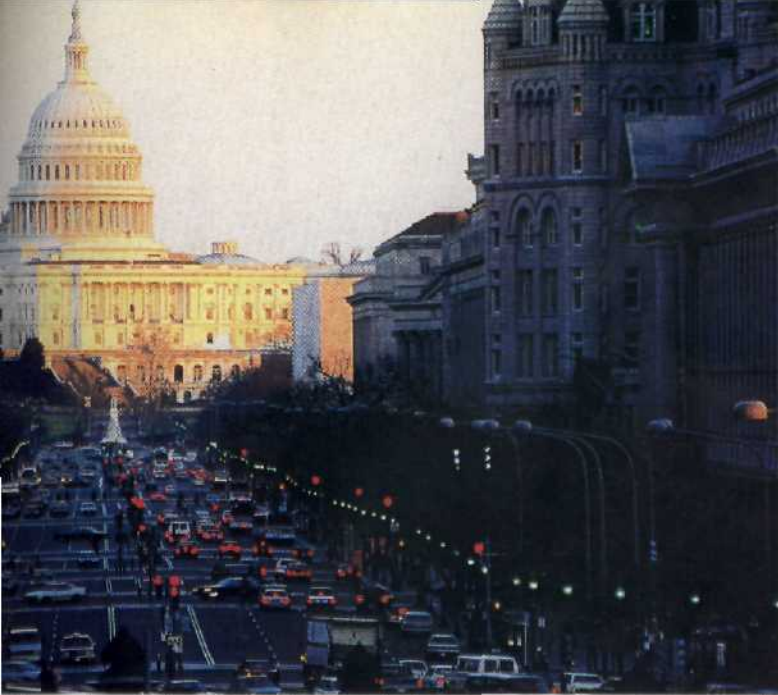
Die Pennsylvania Avenue mit dem Capitol.....32