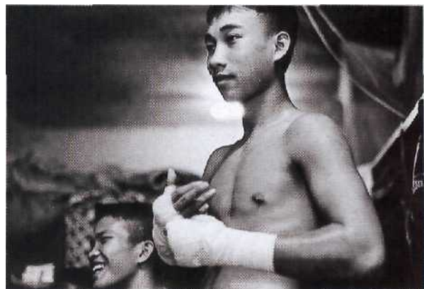
62 Bereit, sich durchzuschlagen: Wer ein Muay-Thai-Champion werden will, muss Tag und Nacht im Boxstall verbringen