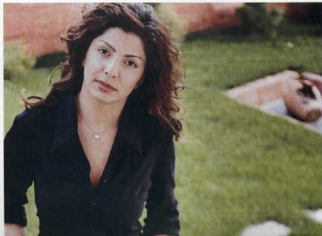
46 Filmproduzentin Elif Yüceel: nach der Rückkehr aus Deutschland neues Glück in Istanbul