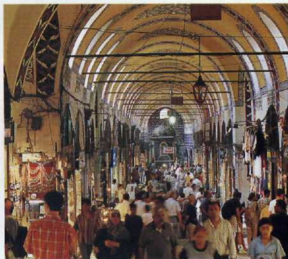
68 4500 Läden in 60 Gassen, 20 000 Händler und Helfer: Istanbul hat den größten überdachten Basar der Welt