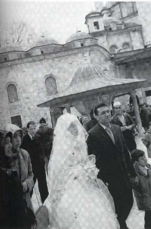
Traditionelle Hochzeit im islamischen Viertel: Eyüp bestimmt der Glaube den Alltag

86 Fantasie ohne Grenzen: Westliche Künstler malten sich aus, was hinter den Mauern des Harems geschah