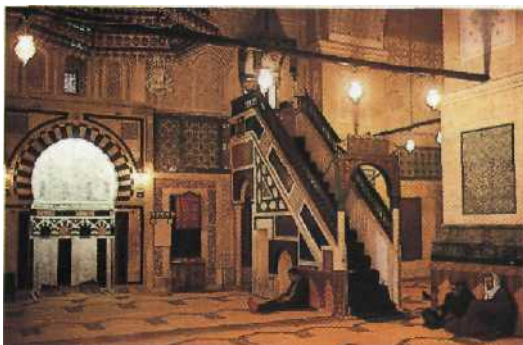
Herz von Tunis: die Moschee Sidi Mähret.....34