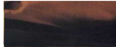
TOT zur Sahara: goldenes Sand/nee