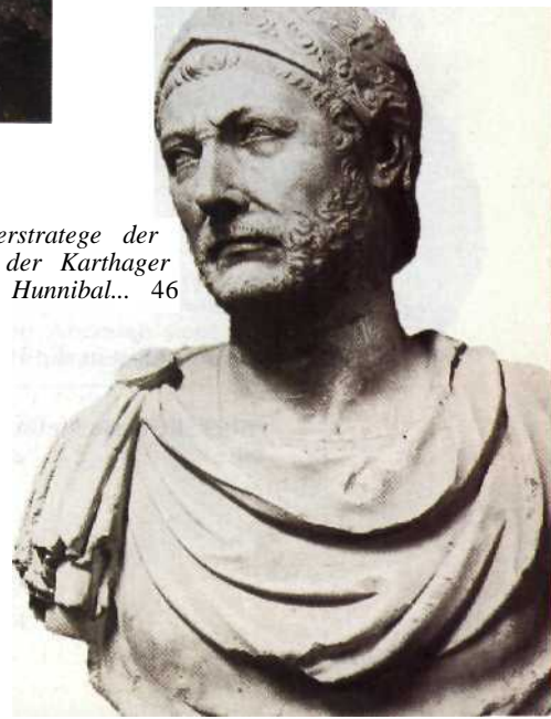
Oberstrategie der Antike: der Karthager Hunnibal... 46