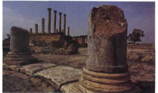
Grüße des Imperiums: Römer-Seh ätze. .60