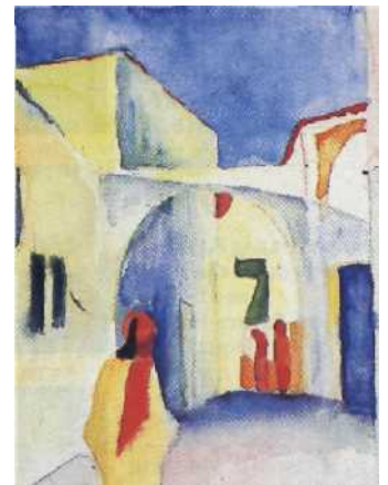
Kunstereignis: die Tunisreise... 66