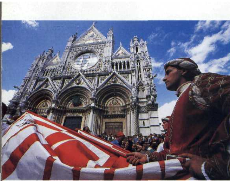
96 Der Stolz von Siena: Palio-Festzug und gotischer Dom