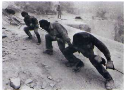
106 Männer bei harter Arbeit: in den Marmorgruben der Apuanischen Alpen