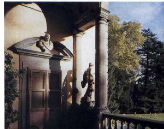
64 Elegant: Blick in den Garten der Villa Mansi bei Lucca

116 Purer Genuss: toskanischer Schinken mit frischen Feigen