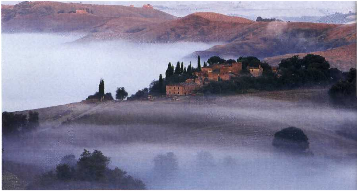
16 Landstrich voller fantastischer Feinheiten: die Hügel der Crete bei Asciano