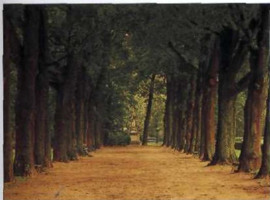
Allee im Parc du Cinquantenaire