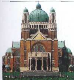
Basilique National du Sacré-Coeur