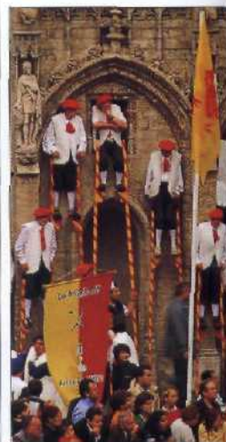
Umzug in farbenprächtigen Kostümen auf der Grand Place