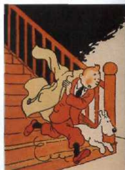
Belgische Helden: Tim und Struppi