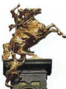
Vergoldete Statue an der Fassade eines Gildehauses in Antwerpen