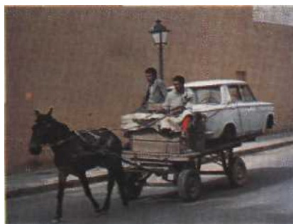
Zeitmaschine: Altes und Neues existiert in Marrakesch nebeneinander, oft in skurriler Weise Seite 52