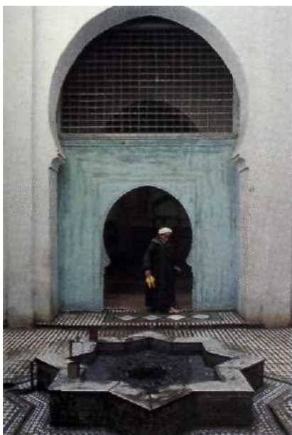
Die Stadt als Museum: Fes, die älteste marokkanische Königsresidenz, ist eine der schönsten Städte der Welt Seite 28