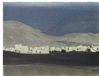
Viertausender: Der Hohe Atlas, das maghrebische Hochgebirge, zieht europäische Bergtouristen an Seite 46