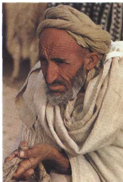
Freie Männer: Die Herber sind stolz auf ihre Tradition. Noch ist die alte Kasbah und ihre Lebensform nicht tot Seite 36