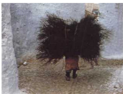
Spanische Wände: Marokko reicht von andalusisch anmutenden Städten im Norden bis in die Wüste Seite 14