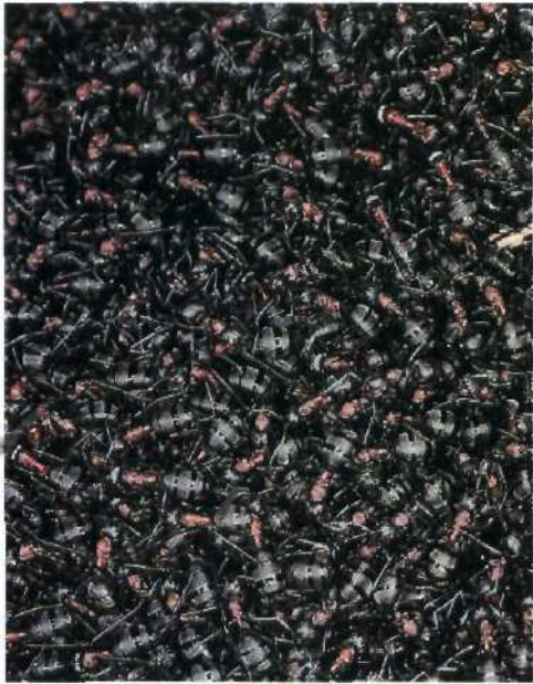
Sozial lebende Insekten Ein Leben für die Königin 96 Die Superorganismen sozialer Insekten sind perfekter organisiert als fast alle Sozialgebilde der Wirbeltiere