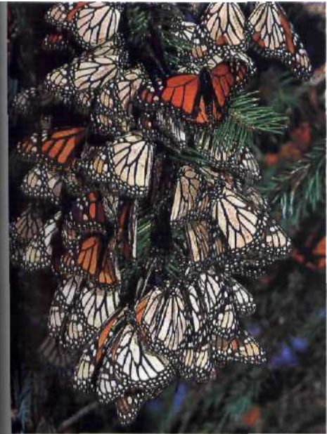
Weitwandernde Schmetterlinge Die Zarten und die Zähnen 172 Monarchfalter überwinden Tausende Kilometer. Was gibt den Faltern diese Kraft?