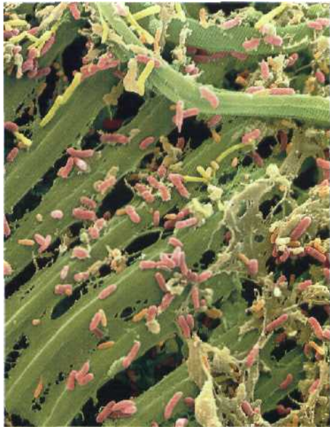
Im Reich der Bodenorganismen Millionen für das Paradies 196 Zur Wiederauferstehung gehört das Zersetzen und das Umwandeln. Die Bodenorganismen haben diesen Job übernommen.