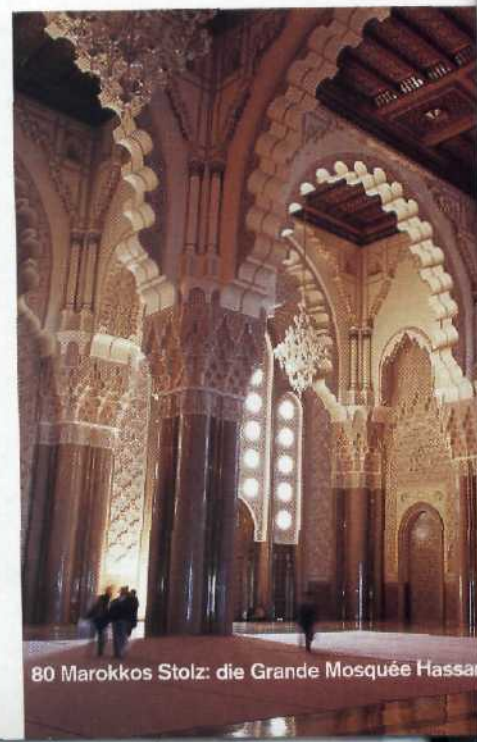
80 Marokkos Stolz: die Grande Mosquée Hassan