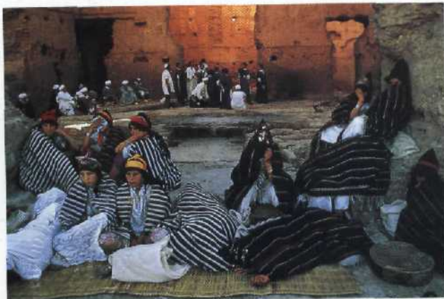
104 Braut-Show im Hohen Atlas: Schnäppchen für Berber