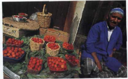
38 Im Souk von Fes: Bürgerstadt in Bauernhand