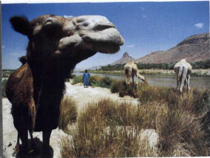
54 Kamele, Kasbahs und Blaue Männer: Reise ins Tal des Draa