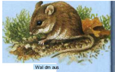
Wal dm aus