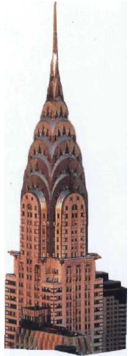
Chrysler Building: Ein Jahr (anj); war es das höchste Gebäude der Stadi.