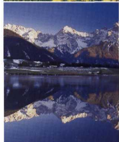
Oben: Märchenschloss in den bayerischen Alpen: Das Schachenschloss überrascht mit orientalischem Interieur. Mitte: Zum Schönsten im alpinen Sommer gehören die blühenden Bergwiesen, hier vorm Zugspitzmassiv. Unten: In stillen Seen spiegelt sich das Karwendelgebirge bei Mittenwald.