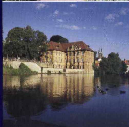
Oben: Seebad schon zu wilhelminischer Zeit: Sellin auf Rügens Halbinsel Mönchgut mit stattlicher Seebrücke. Mitte: Starke Farben liebt der Norden: wie hier am »Blauen Haus« im viel besuchten Zingst. Unten: Ein Juwel in Deutschlands grüner Mitte: Bamberg, mit dem Gartenschloss »Concordia« an der Regnitz.