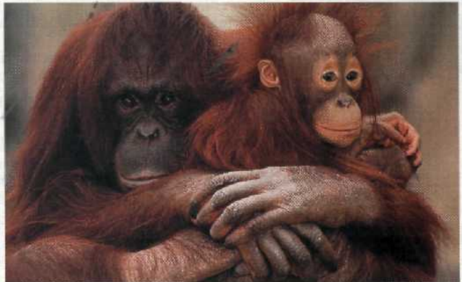
Lernen, wieder Affen zu sein: Orang-Utans auf Borneo.....100