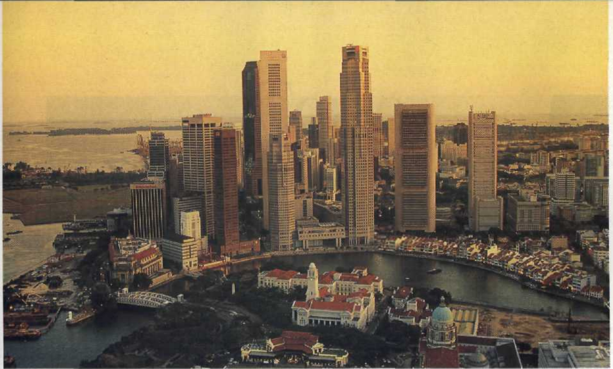
Hoch hinaus: Singapurs Skyline ist Südostasiens Konjunkturbarometer .....38