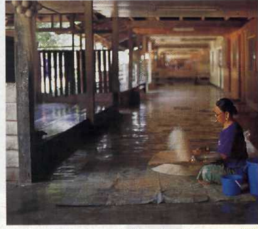
Kultur im Dschungel: Iban-Langhaus .....84