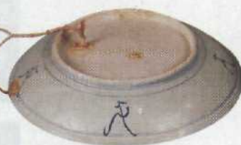
Der Schatz der „Diana“: China-Porzellan, wie neu..... 75