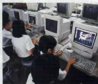
Singapur: Hier üben sich schon die Kinder am Computer..... 56