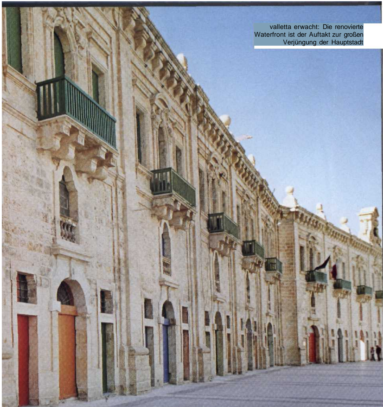
valletta erwacht: Die renovierte Waterfront ist der Auftakt zur großen Verjüngung der Hauptstadt