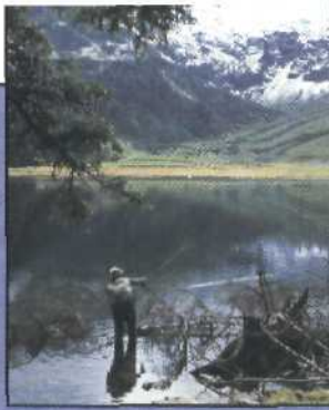
Titelbild: Fliegenfischer am Hintersee im Oberpinzgau.