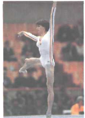
Nadia Comanecis Olympiasiege im Turnen 1976 in Montreal erleichterten ihren dornigen Lebensweg nicht.