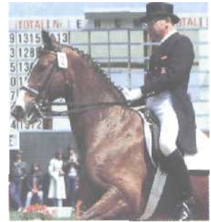
Der Anwalt Dr. Reiner Klimke stieg mit sechs Goldmedaillen zum erfolgreichsten Reiter aller Zeiten bei Olympia auf.