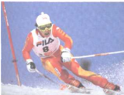
Vreni Schneider (Schweiz) beim Riesenslalom,