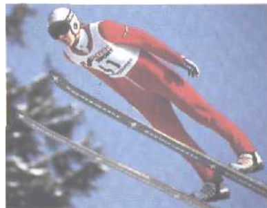
Der Finne Matti Nykänen beim Skispringen.