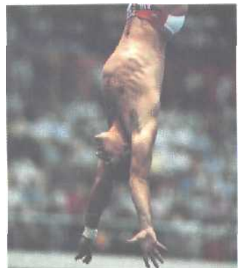
Greg Louganis (USA) war im Kunst- und Turmspringen eine Klasse für sich.