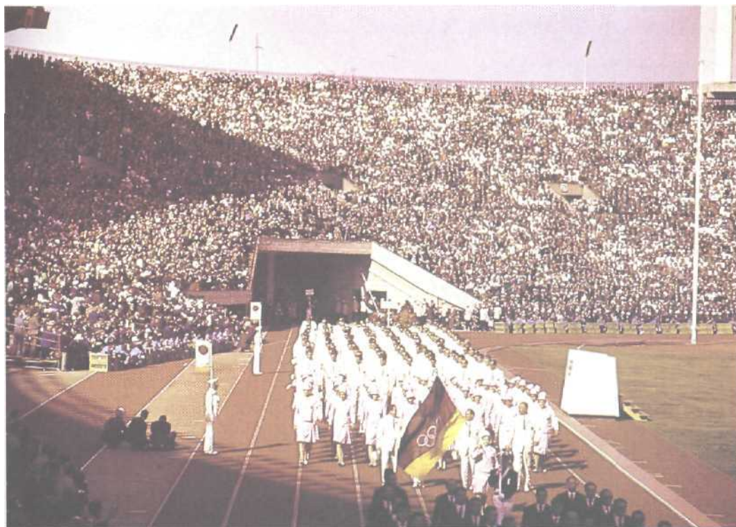
Das letzte Mal marschierte 1964 in Tokio eine gesamtdeutsche Mannschaft zur olympischen Eröffnung ein. Nach der Vereinigung der beiden Nationalen Olympischen Komitees am 18. November 1990 wird dies in Barcelona 1992 nach 28 Jahren wieder der Fall sein.