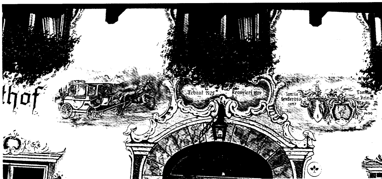
»Lüftmalerei« an einem alteingesessenen Tiroler Gasthof