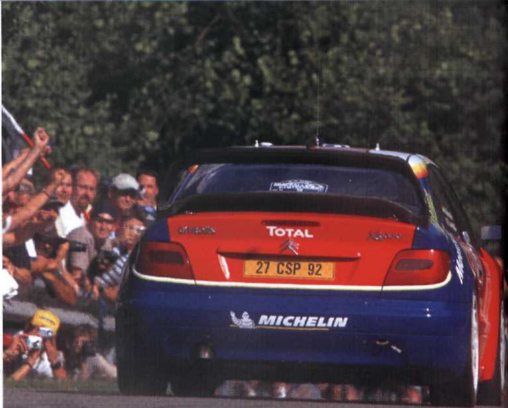
Macht-Wechsel - Neueinsteiger Citroën (oben) löst Peugeot als Marken-Weltmeister ab. Subaru-Pilot Petter Solberg gewinnt den Fahrer-Titel