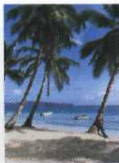
TITEL: Die Playa Las Galeras