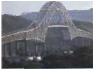
Verbinden, was der Wasserweg zerschneid Panama: Puente de las Americas bei Baiboa