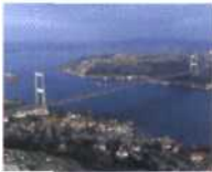
Das Tor zum Orient Istanbul: Bosphorus-Brücke