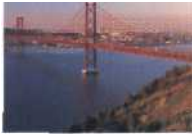
Wahrzeichen der Nelkenrevolution Lissabon: Die Brücke des 25. April