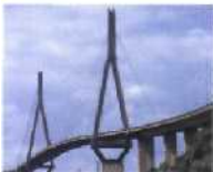
Triumphbogen am Hafen Hamburg: Köhlbrandbrücke