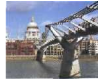
Ein Lichthalm über die Themse London: Millennium Bridge