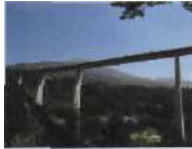
Für Frieden und Einheit Bei Innsbruck: Europabrücke