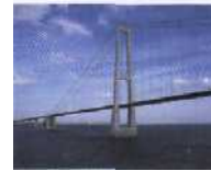
Weltrekord im Kabelspinnen Über den großen Belt: Die Ostbrücke