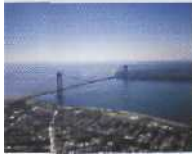
In Harmonie mit der herrlichen Landschaft New York: Verrazano Narrows Bridge