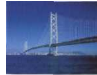
Herausforderung der Götter Kobe: Akashi i-Kai kyo-Brücke