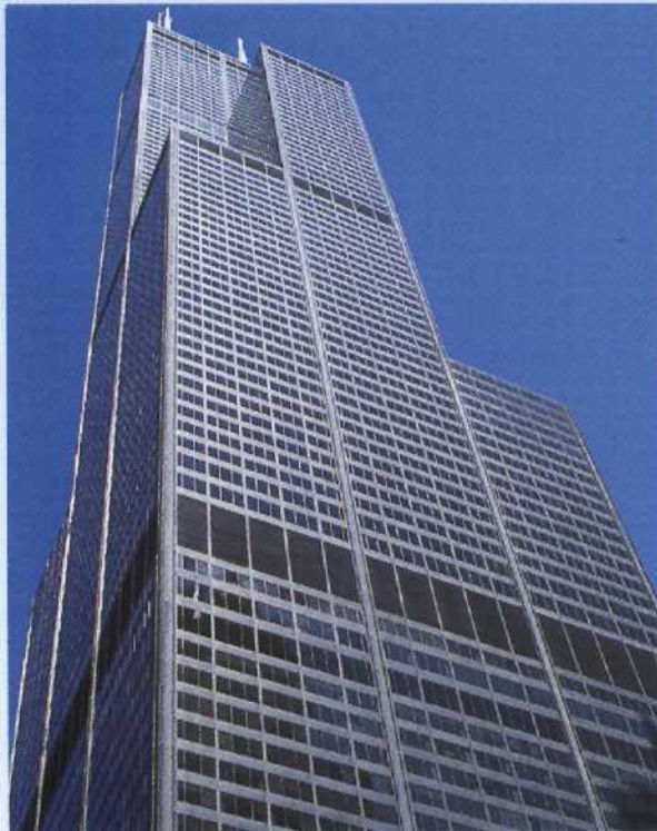
Sears Tower, Chicago