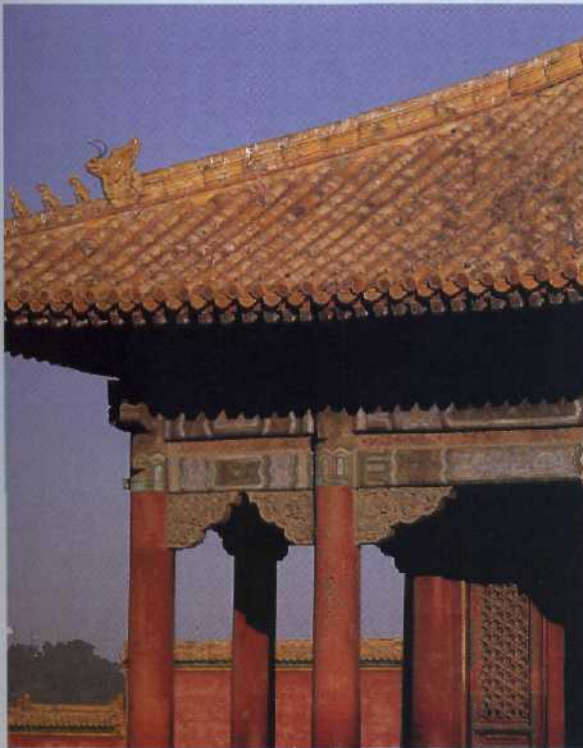
Die Verbotene Stadt, Peking