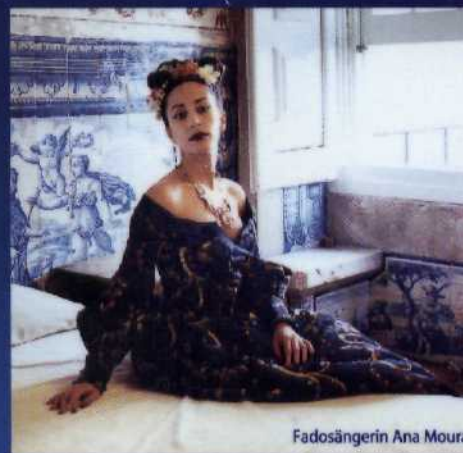
Fadosängerin Ana Moura