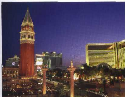
Das luxuriöse Venetian mit Blick auf den Strip (siehe S. 58f)