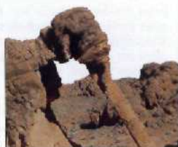
Red Rock Canyon