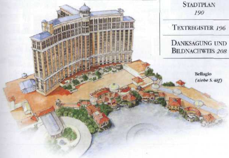
Bellagio (siehe S. 48f)