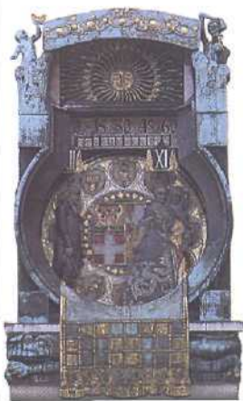
Ankeruhr aus Bronze und Kupfer am Hohen Markt (siehe S. 84)