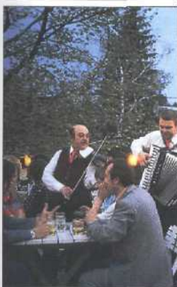
Musik im Garten eines Heurigenlokals (siehe S. 202ff)