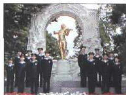
Wiener Sängerknaben (siehe S. 39)

NAHVERKEHRSPLAN Hintere Umschlaginnenseite