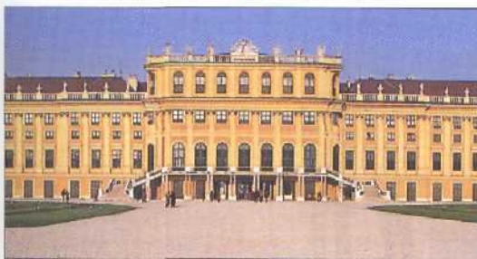
Vorderansicht des Schlosses Schönbrunn (siehe S. 172ff)