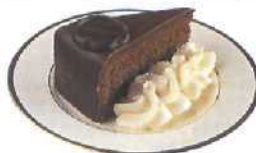
Sachertorte (siehe S. 209)