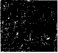
DUBROVNIK - Old City / Altstadt / 8