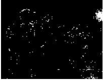
PLITVICKA JEZERA / PLITVITZER SEEN - National Park / Nationalpark / 42