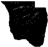
TROGIR - Historic City / Altstadt / 56