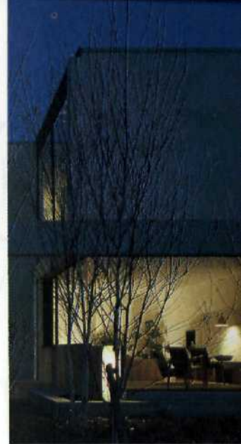
WOHNEN IN DER NACHT