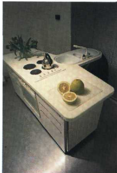
DIE FUNKTIONALE KÜCHE