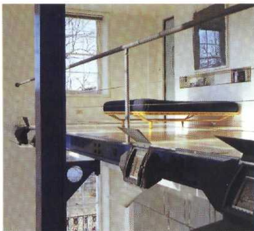
DIE AUFTEILUNG DES RAUMES