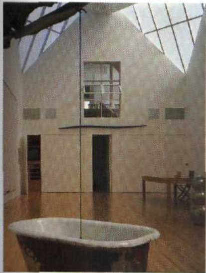
DAS WOHNHAUS ALS GALERIE