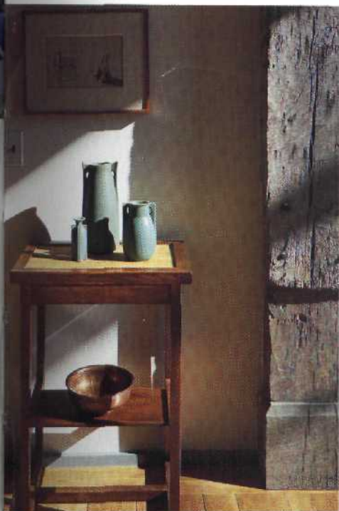
DIE NEUE MODERNE UND DIE GESCHICHTE