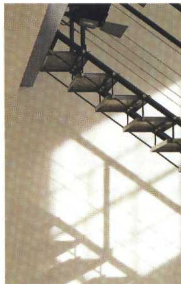
DIE TREPPE ALS BLICKPUNKT