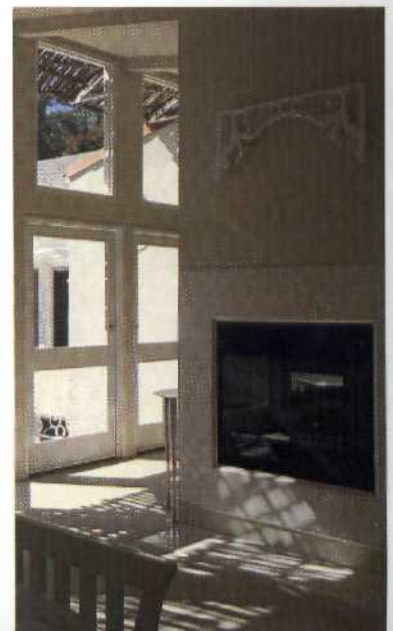
DER EINSATZ VON LICHT