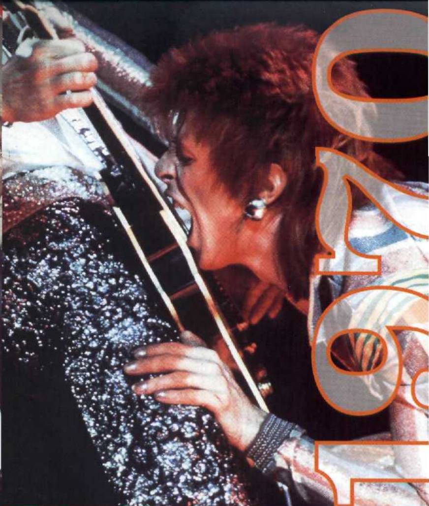
1970-79: Glamrock, Disco und Punk