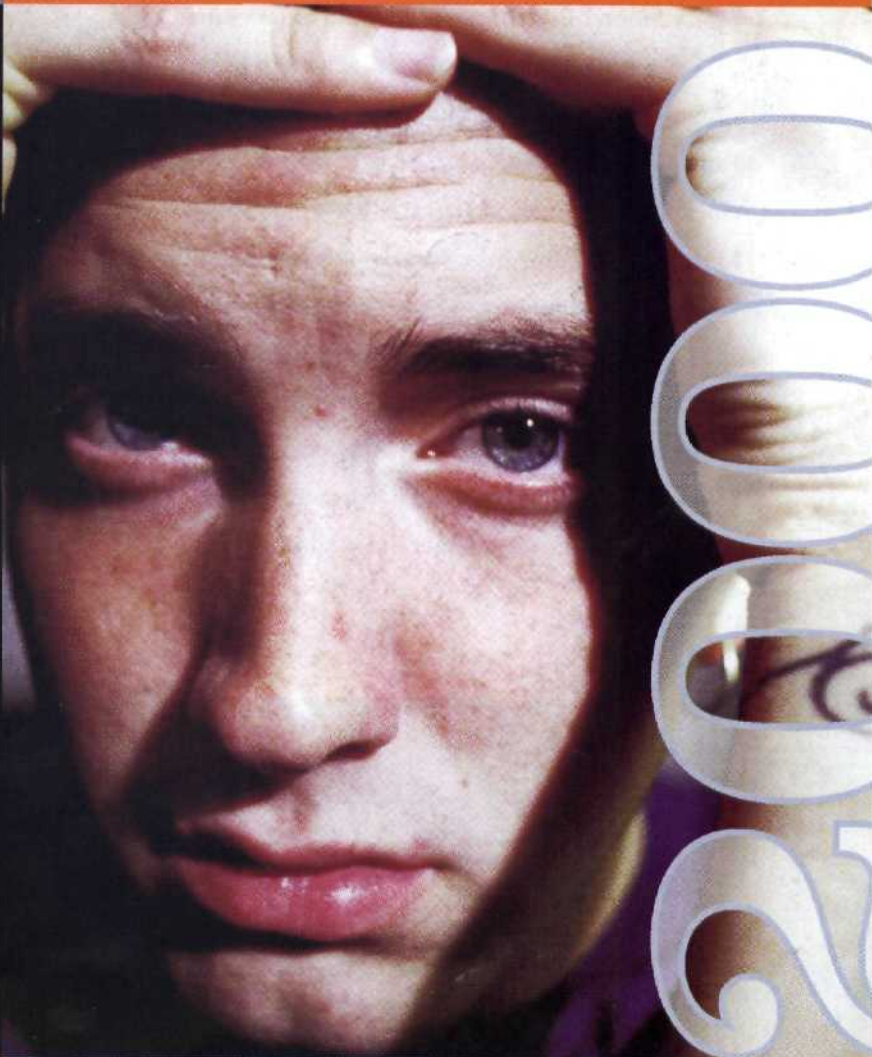
2000-02: Die neue Generation