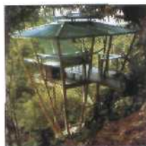
14 BAMBOO HOCH, PUERTO RICO