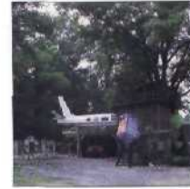
50 SAMS BAUMHAUS