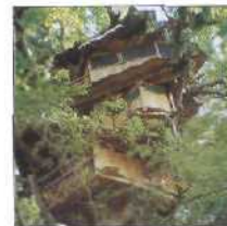
40 DAS DSCHUNGEL-BAUMHAUS