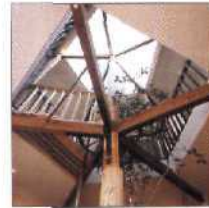
36 EIN BAUMHAUS AUS MISOFÄSSERN