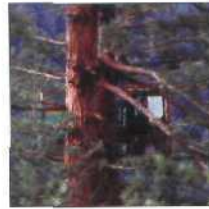
24 MARIAH'S MANOR