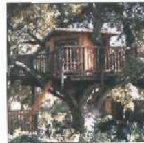
44 DAS BAUMHAUS DER FAMILIE ENGEL