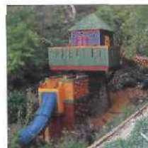
28 CANYON PERCH IN KALIFORNIEN