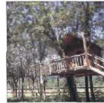
48 OUT 'N' ABOUT RESORT, OREGON