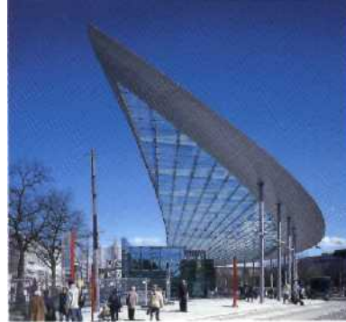
Neuer ZOB in St. Georg