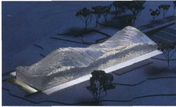
Outlet Center (Entwurf: Jörg Friedrich)