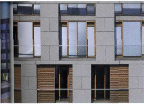
Citterio-Haus, Neuer Wall