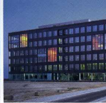
Geschäftsstelle und Schulungsgebäude SAP