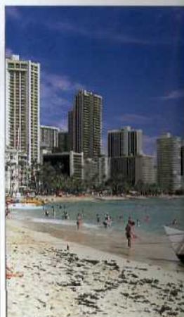
Waikiki Beach und Diamond Head