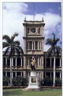
Ali'iolani Hale, das Justizgebäude in Honolulu