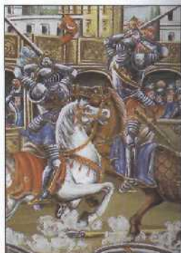
Bühnenprospekt, Museo delle Marionette in Palermo (siehe S. 48f)