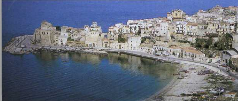
Castellammare del Golfo (siehe S. 92), eines der vielen Fischerdörfer an Siziliens Küste