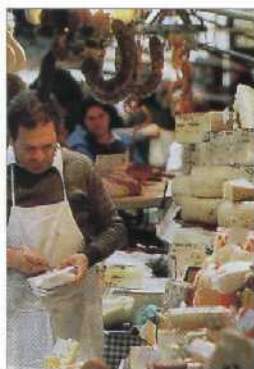
Käsehändler auf dem Markt von Catania (siehe S. 210f)