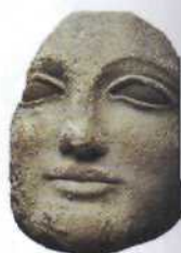
Frauenkopf aus dem 5. Jahrhundert v.Chr. (siehe S. 28f)