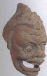
Alte Theatermaske, Museo Eoliano (siehe S. 186)