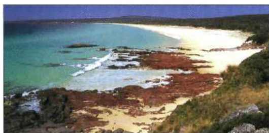
Ben Boyd National Park an der Südküste von New South Wales