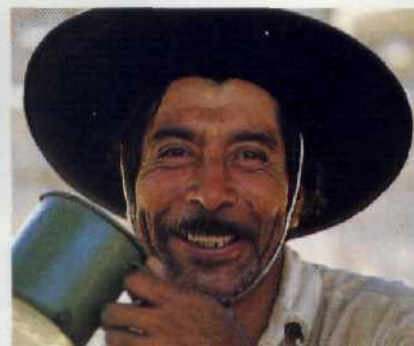
Gaucholand: Rinder haben Argentinien reich gemacht. Die Romantik der Gauchos ist längst dahin Seite 52