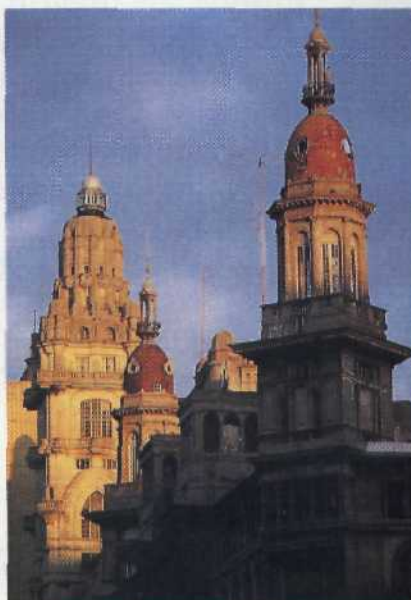
Buenos Aires: eine Metropole nach europäischem Vorbild Seite 20