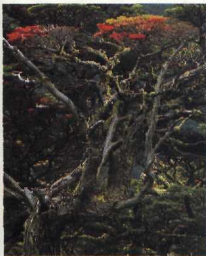
Feuerland: Der Sommer tief im Süden ist kurz. Um so heftiger treibt die Natur ihre Blüten Seite 96