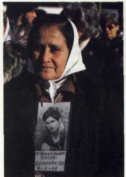
Immer noch suchen die Mütter nach den während der Diktatur spurlos Verschwundenen Seite 66