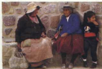
Indioland: Einst gehörte ihnen das Land. Heute trennen sie Welten vom modernen Argentinien Seite 62