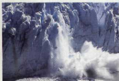
Patagonien: Der Moreno-Gletscher entläßt sich von Zeit zu Zeit in gewaltigen Explosionen Seite 34