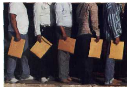
Die Dritte Welt steht Schlange: Tausende drängen täglich legal und illegal über den Rio Grande Seite 4*