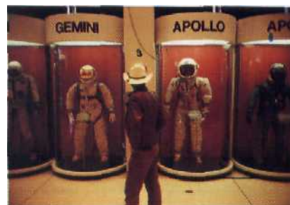
Alles hört auf Houstons Kommando: Energiewirtschaft und Raumfahrt werden hier gesteuert Seite 34