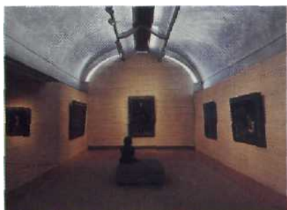
Lohnender Kunsttrip nach Texas: Architekten und Mäzene lassen in der Prärie Museen blühen Seite 112