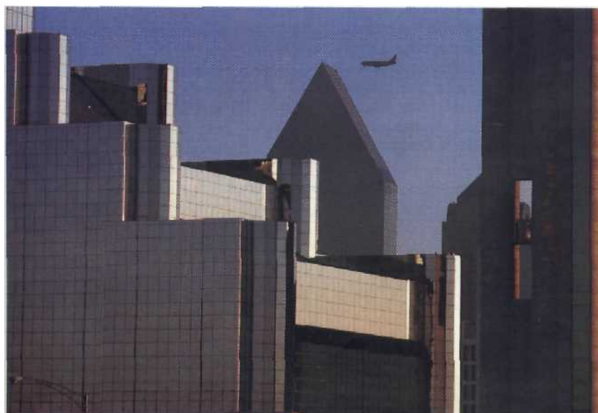
Hochhausflotte hält Kurs: Noch steht auch in Dallas Büroraum leer, aber das Finanzzentrum desSüdwestens hat den Ölpreisschock überwunden Seite 88