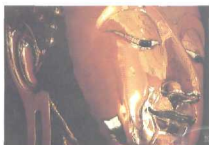
Buddhismus: Die goldene Maske im Königlichen Palast in Bangkok weist den Pfad zur Erleuchtung Seite 132