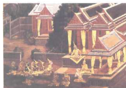
Das Wat Phra Keo in Bangkok mit einem Wandgemälde zu Ehren der Chakri-Dynastie Seite 34