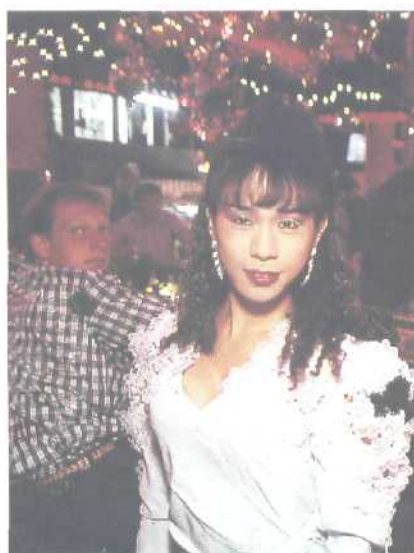
Käufliche Liebe: Mädchen tragen zum Unterhalt der Familie bei Seite 75