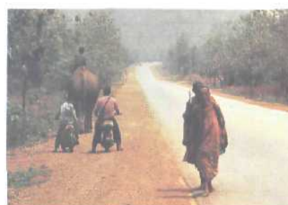
Elefant am Straßenrand: Dickhäuter, einst geschätzte Arbeitskräfte, weichen dem Fortschritt Seite 84