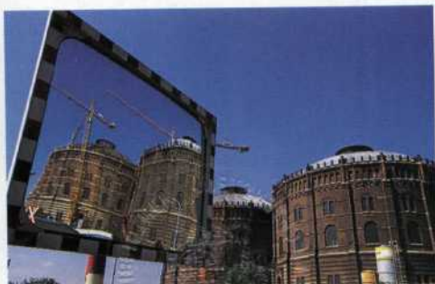
76 Gasometer: Monumente der Architektur