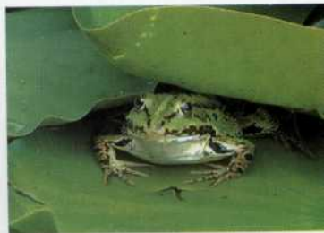
108 Donau-Auen: stille Rückzugswinkel