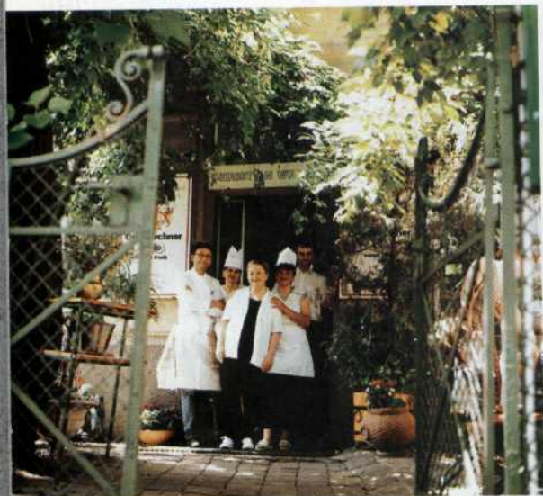
62 Gastgärten: Willkommen zum Schnitzel im Schatten