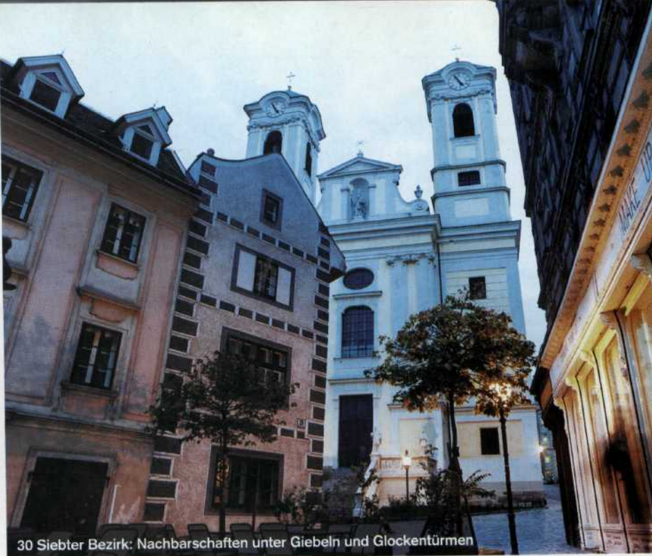
30 Siebter Bezirk: Nachbarschaften unter Giebeln und Glockenfürmen