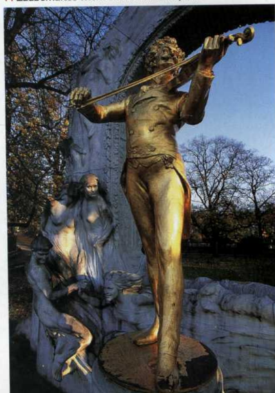
14 Zauberhaftes Wien: Strauß im Stadtpark