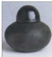
Kleines Deckelgefäß 32