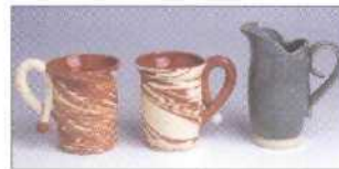
Kleiner Krug 104