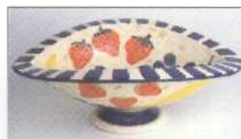
Ovale Fruchtschale mit Fuß 46