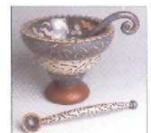
Selbst entwerfen 136