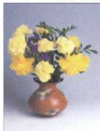
Dekorierte und polierte Vase 42