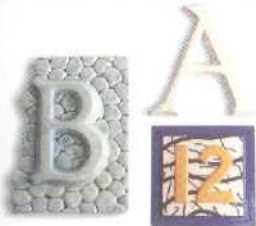
Ziffern und Buchstaben 81