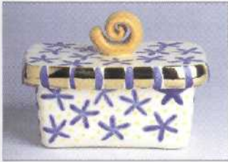
Butterdose mit Aufglasur- Dekoration 70