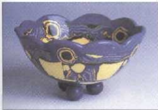
Schale aus buntem Ton 76