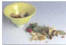
Potpourri-Schale mit Lochmuster 38