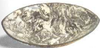
Marmorierte ovale Schale 84