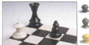
Türknöpfe und Schachfiguren 110