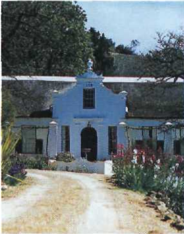
48 Quintessenz des kultiviert-ländlichen Lebens: Weingut mit feiner Küche