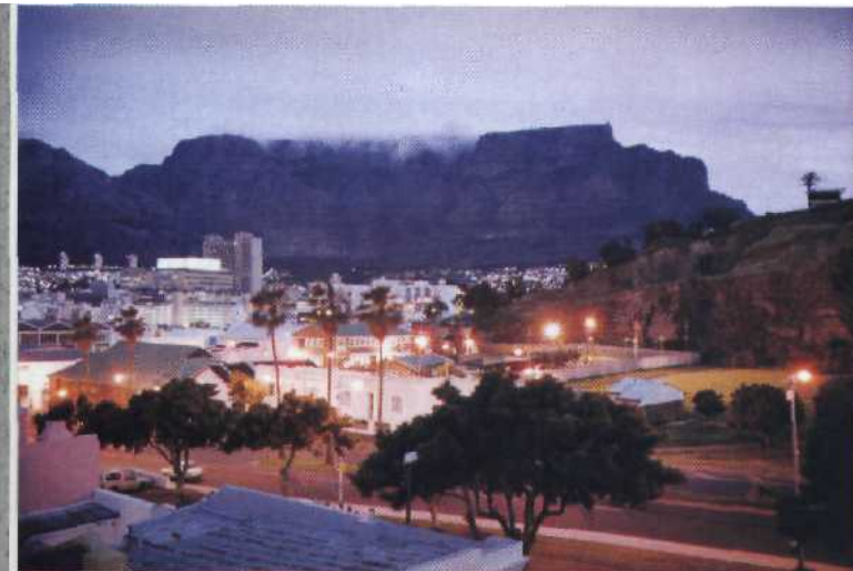
34 Kapstadt das glitzernde Ende der Welt