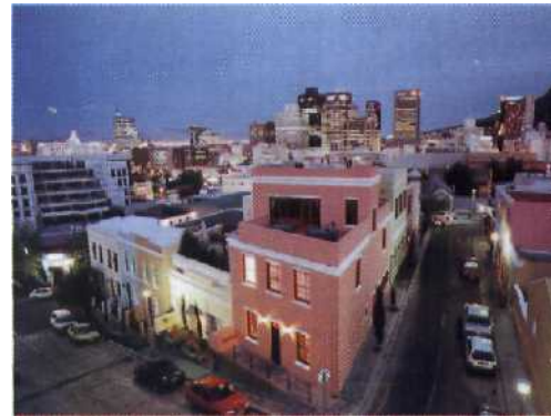
Kapstadts City-Chic: historisches Viertel „De Waterkant“ mit elegant restaurierten Stadtresidenzen

Fahren Sie hin. Das neue Südafrika hat Farben, die wir lange Zeit nicht entdecken durften. Ihr