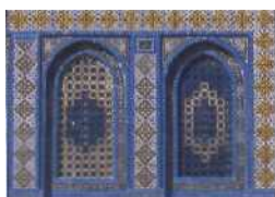
Fenster 1 in Feist iium