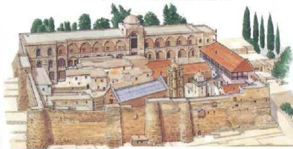
Das Kathariienkloster auf dem Sinai