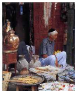
Markt mit Kunsthandwerk