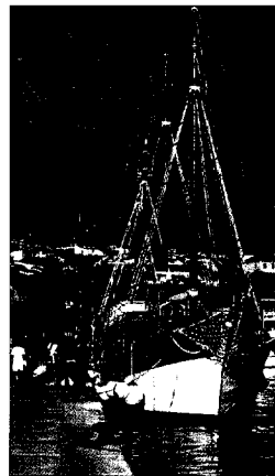
Buntes Treiben im malerischen Hafen von Makarska