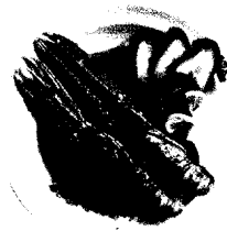
Das dalmatinische Gericht Buzara : Scampi in Tomatensauce