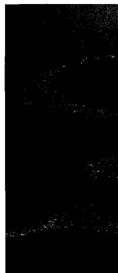
Traubucht auf der Insel Mljet

◀ Der goldene Strand von Bol auf der Insel Brač