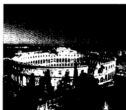
Römisches Amphitheater in Pula