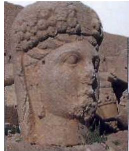
KummagencSicinhauptamBein ,cmrul ^^elll^lt Dagij