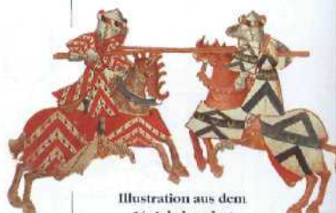
Illustration aus dem 14. Jahrhundert