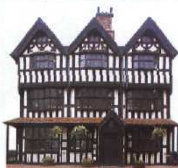
Haus in Hereford aus der Zeit von James I