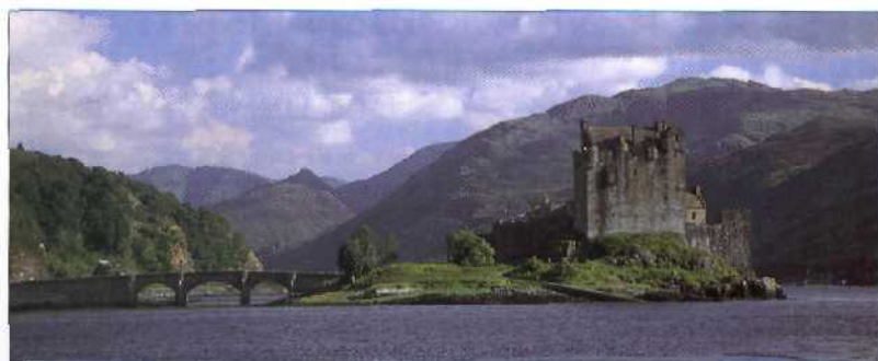
Eilean Donan Castle auf einer Insel im Loch Duich im schottischen Hochland