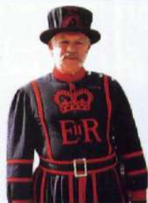
Beefeater im Tower von London